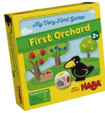
FIGURE 1 – Premier Verger est un jeu pour enfants à partir de 2 ans.